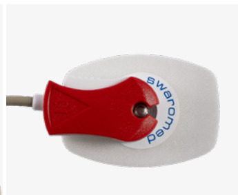
EKG-elektrode med metallknapp