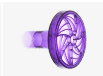
Bakterie- og virusfilter