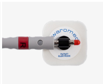
EKG-elektrode til bananplugg